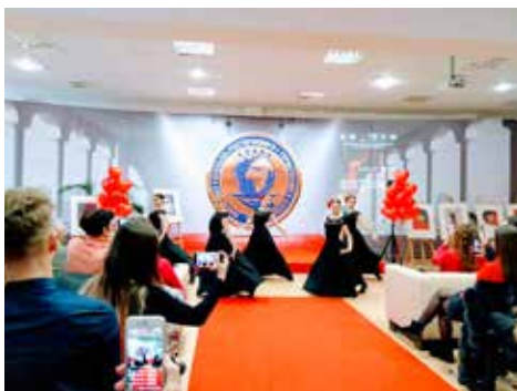
"Viento de pueblo" KIEV 2019.

In summary, if his painting is a painting of consciousness, it is not less true that in his creative process an outstanding stage of conscience of painting is included, where several experiences, techniques, strategies and resources come together to form his particular plastic language, which does not end up being a means for ideological communication, but, in parallel, is constituted as a register of an obvious aesthetic communication.