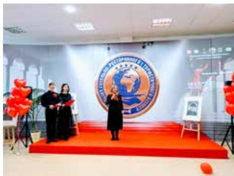
"Viento de pueblo" KIEV 2019.