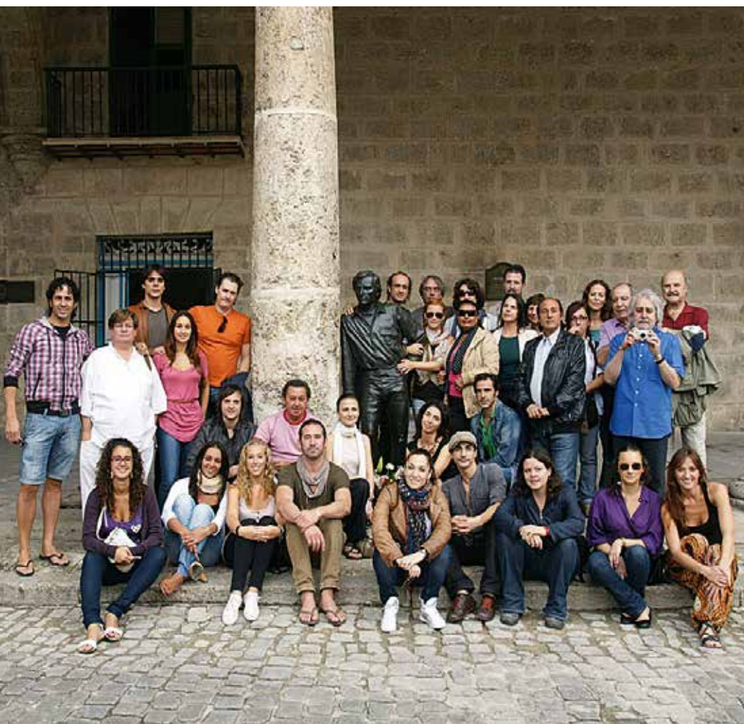
Antoni Miró amb la Cia. Gades, L'Havana 2011.